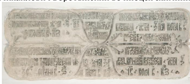
Рис. 2. Резная плита из церкви Владимира с надписями о захоронениях Владимира Ивановича, Александра Ивановича, Михаила Ивановича и Логина Михайловича Воротынских. Фото 2019 г.