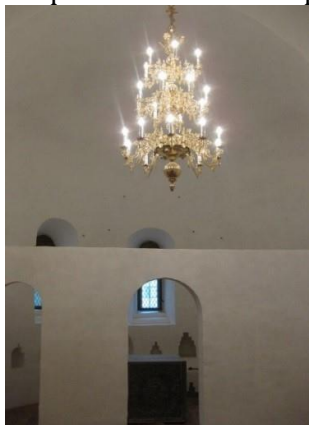
Рис. 3. Интерьер церкви Владимира после проведения реставрационных работ. Фото 2017 г.

Церковь Владимира, также, как и весь центральный соборный комплекс монастыря, в состав которого она входит, требовала реставрации и была закрыта для экскурсионного показа в 1960-е гг. Реставрация комплекса началась в 2010 г. В ходе работъ было выполнено устройство дренажа по периметру соборного комплекса, проведена реставрация фасадовъ, кровли, выполнено устройство электроподогреваемыхъ полов и другие работы. В церкви Владимира была разобрана иконостасная рама XIX в. и воссоздана первоначальная алтарная кирпичная преграда (Рис. 3) [6].